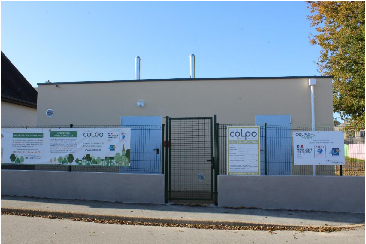
Photo : vue de la façade du nouveau bâtiment, chaufferie centrale-groupe scolaire le Petit Prince